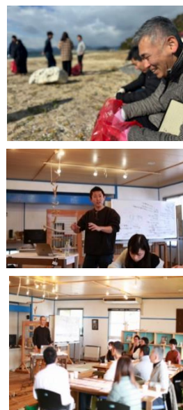
図: プログラム構成の例とウェルビーイング(※5)