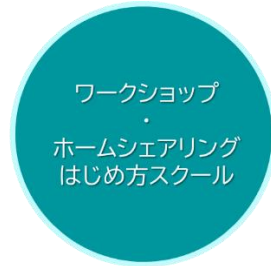
やってみたいを応援・支援