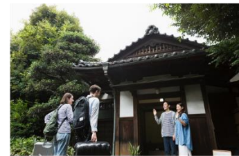
空き家を活かし、ホームシェアリングホストへ