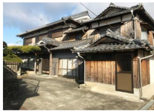
空き家はあるが、活かしていない