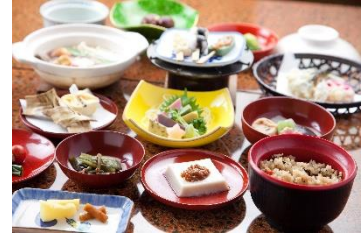
精進料理(イメージ)