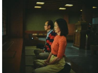
坐禅体験(イメージ)