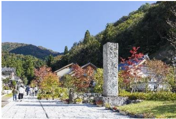
大本山永平寺・旧参道

株式会社 JTB、松岡交通株式会社、日本商運株式会社が連携し、福井県永平寺町で日本版ライドシェアを活用したインバウンドを含む県外観光客向けの観光タクシープラン「永平寺町・禅の里観光タクシープラン」を1月9日(木)より販売開始します。今回の連携を通して実現した官民連携型のライドシェア・旅行企画による観光の力で、二次交通の脆弱性、担うドライバー不足、インバウンド向けのコンテンツ不足などを始めとする様々な地域課題の解決を目指してまいります。