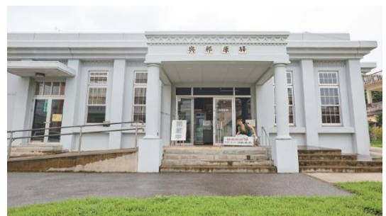
▲ 軽便与那原駅舎展示資料館