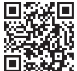
▲見学会受付フォーム

●JTB時刻表100周年サイト： https://jtbpublishing.co.jp/campaign/jtbjikoku100th/