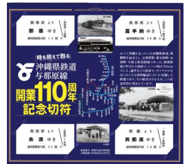
▲記念のクリアファイルと110周年記念硬券を配布