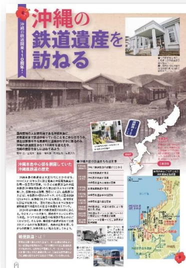
▲JTB 時刻表 12 月号 沖縄県鉄道の記事