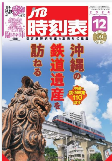
▲JTB 時刻表 12 月号の表紙