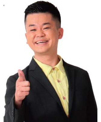
▲沖縄軽便鉄道芸人 首里のすけ

また与那原駅跡地にたつ軽便与那原駅舎展示資料館では、沖縄の軽便鉄道の歴史が貴重な資料と共に展示されるほか、激しい戦火に耐えた遺構として駅舎近くに残る柱の見学会も開催されます。JTB時刻表編集部が制作した110周年記念のオリジナルの硬券やクリアファイルなどのノベルティも配布します。(ノベルティの配布は無くなり次第終了)